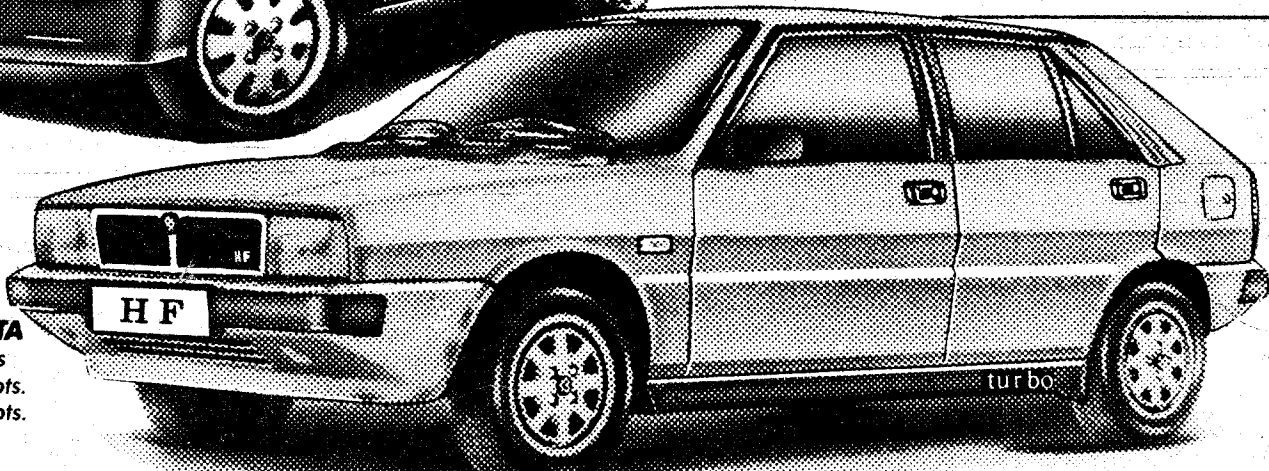
LANCIA DELTA Precios finales GT-1.731.593 pts. HF-2.100.374 pts.